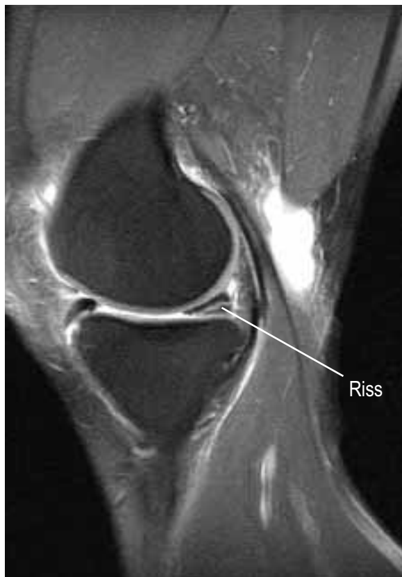
Eine Kernspintomographie bringt Sicherheit

Bei einem akuten, d. h. unfallbedingten Meniskusriss sind auch häufig noch der Bandapparat und die Gelenkkapsel betroffen – dies kann zu weiteren Beschwerden führen, die zunächst nicht immer genau vom Meniskusschaden abgegrenzt werden können. Wichtig ist in jedem Fall, dass die Ursache von Kniebeschwerden festgestellt wird. Ein erfahrener Arzt wird dann nach exakter Untersuchung die weitere Diagnostik veranlassen und geeignete Behandlungsmaßnahmen vorschlagen.